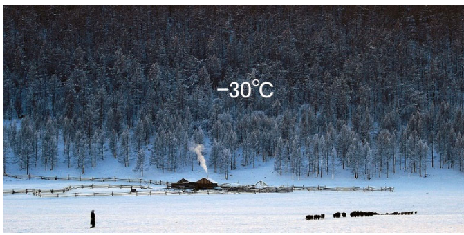
冬は-30°Cになり、夏は+30°Cほどです。