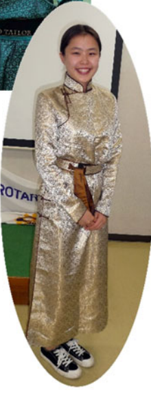
民族衣装の DEEL (デール)

Улаанбаатар хот нь Монгол улсын төвийн хэсэгт, Зүүн-Улаанбаатар аймгийн Улаанбаатар суманд байрладаг. Энэ хот нь Монгол улсын хамгийн том хот бөгөөд улсын засгийн газар, төрийн байгуулал, бизнес, сургуулиуд, музейнүүд, театрууд, спортын байгууллагууд, иргэдийн амьдралын төв болж байгаа билээ. Энэ хот нь Монгол улсын төрийн захиргааны төв, төрийн байгуулал, бизнес, сургуулиуд, музейнүүд, театрууд, спортын байгууллагууд, иргэдийн амьдралын төв болж байгаа билээ.